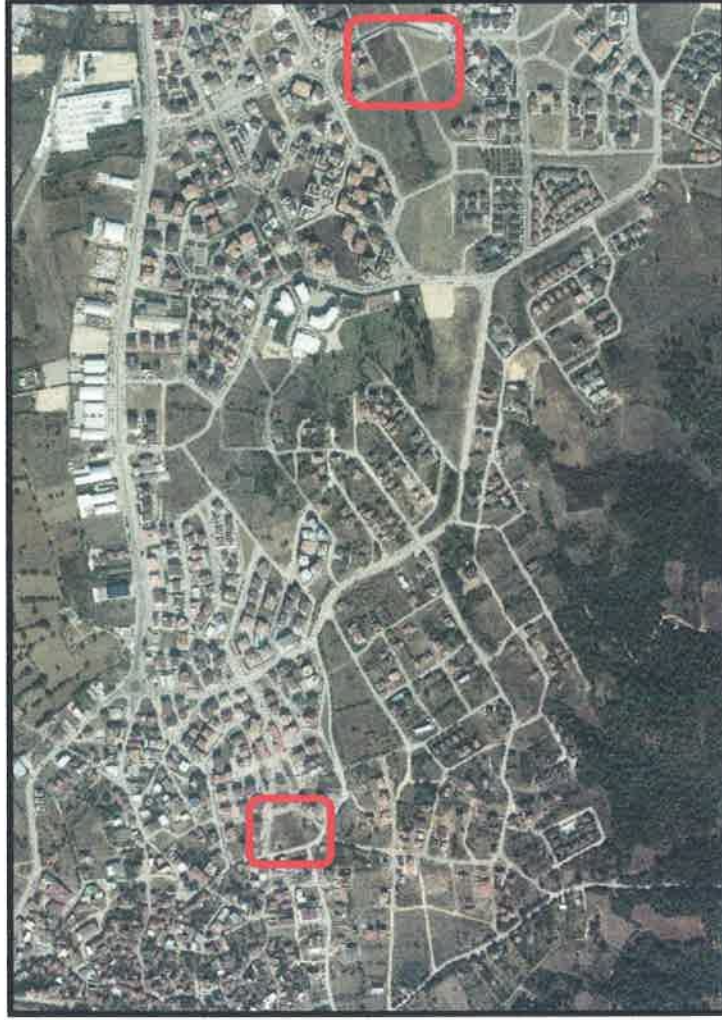
Resim 1: Uydu Görüntüsü

Plan değişikliği yapılan alan, Nilüfer İlçesi Demirci Mahallesi sınırları içerisinde yer almaktadır. 2018 yılı TÜİK verilerine göre Bursa İli Nilüfer İlçesi'nin toplam nüfusu 441.299 kişi olup, plan değişikliğinin yapıldığı Demirci Mahallesi'nin nüfusu 11.797 kişidir.