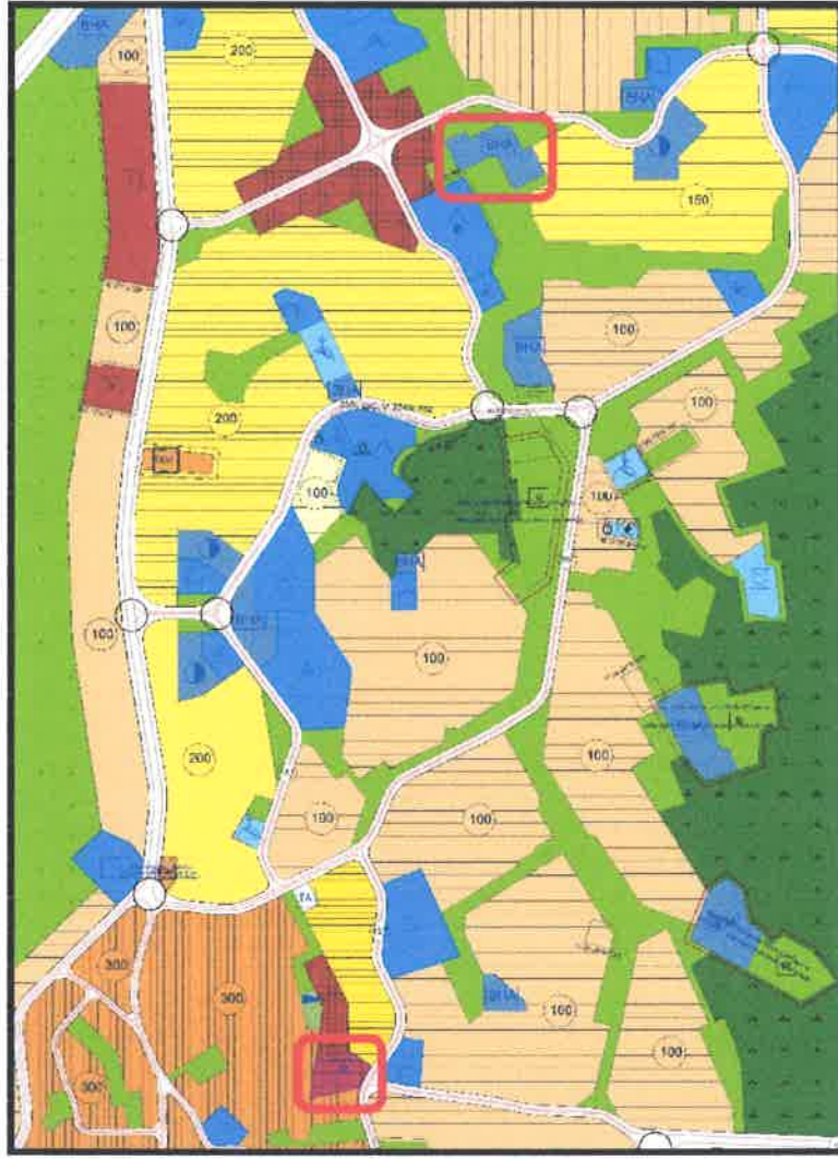
Resim 2. Onaylı 1/5000 Ölçekli NİP